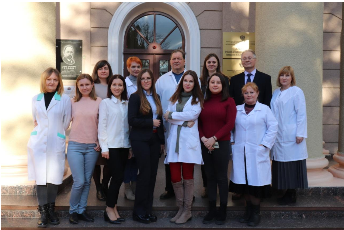
Коллектив кафедры базисной и клинической фармакологии, 2022 год